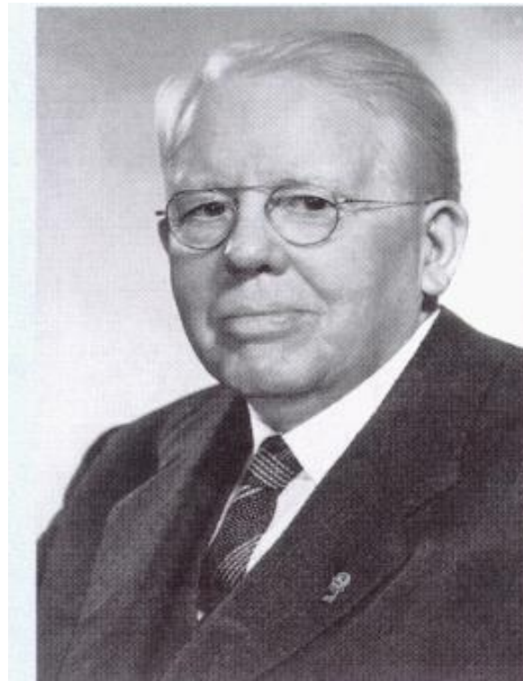
Melvin Jones 1879 - 1961

Lions-järjestö perustettiin Chicagossa 7.6.1917