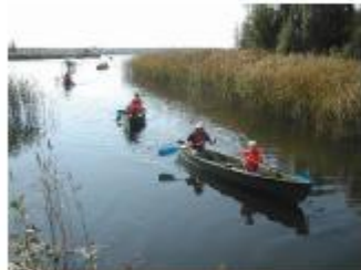
Kokkola 107 O