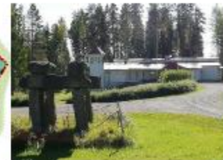
Parkano 107 E