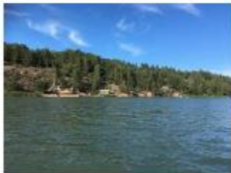
Turku 107 A