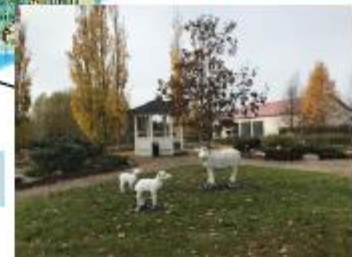
Uusimaa 107 N