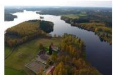
Uurainen 107 G