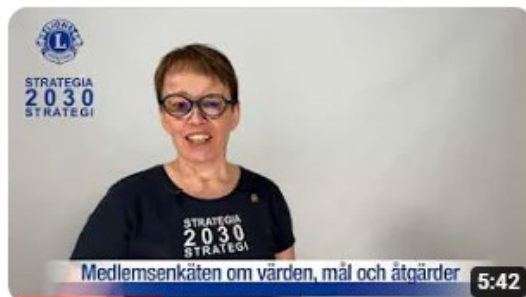
Lions2030Strategi presentation SE